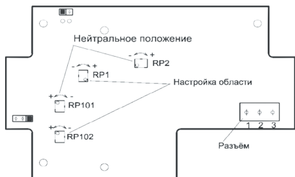
3-х проводное исполнение